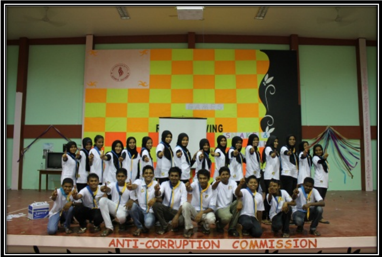
فهرست اعضای کمیته مبارزه با فساد مالی و اقتصادی در استان تهران

در روزهای گذشته با همکاری و مساعدت مسئولان محترم دانشگاه تهران، کمیته مبارزه با فساد مالی و اقتصادی در استان تهران، در محل سالن اجتماعات دانشگاه تهران، جلسه تشکیل داد. در این جلسه، اعضای کمیته مبارزه با فساد مالی و اقتصادی در استان تهران، با حضور مسئولان محترم دانشگاه تهران، در مورد برنامه‌های آموزشی و ترویجی این کمیته، بحث و تبادل نظر کردند. در این جلسه، اعضای کمیته مبارزه با فساد مالی و اقتصادی در استان تهران، با حضور مسئولان محترم دانشگاه تهران، در مورد برنامه‌های آموزشی و ترویجی این کمیته، بحث و تبادل نظر کردند.